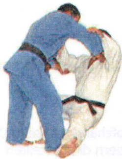
Yoko-otoshi (Seitfallzug) beidseitig