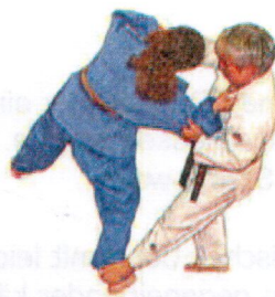
Yoko-gake (Seitfußzug) beidseitig